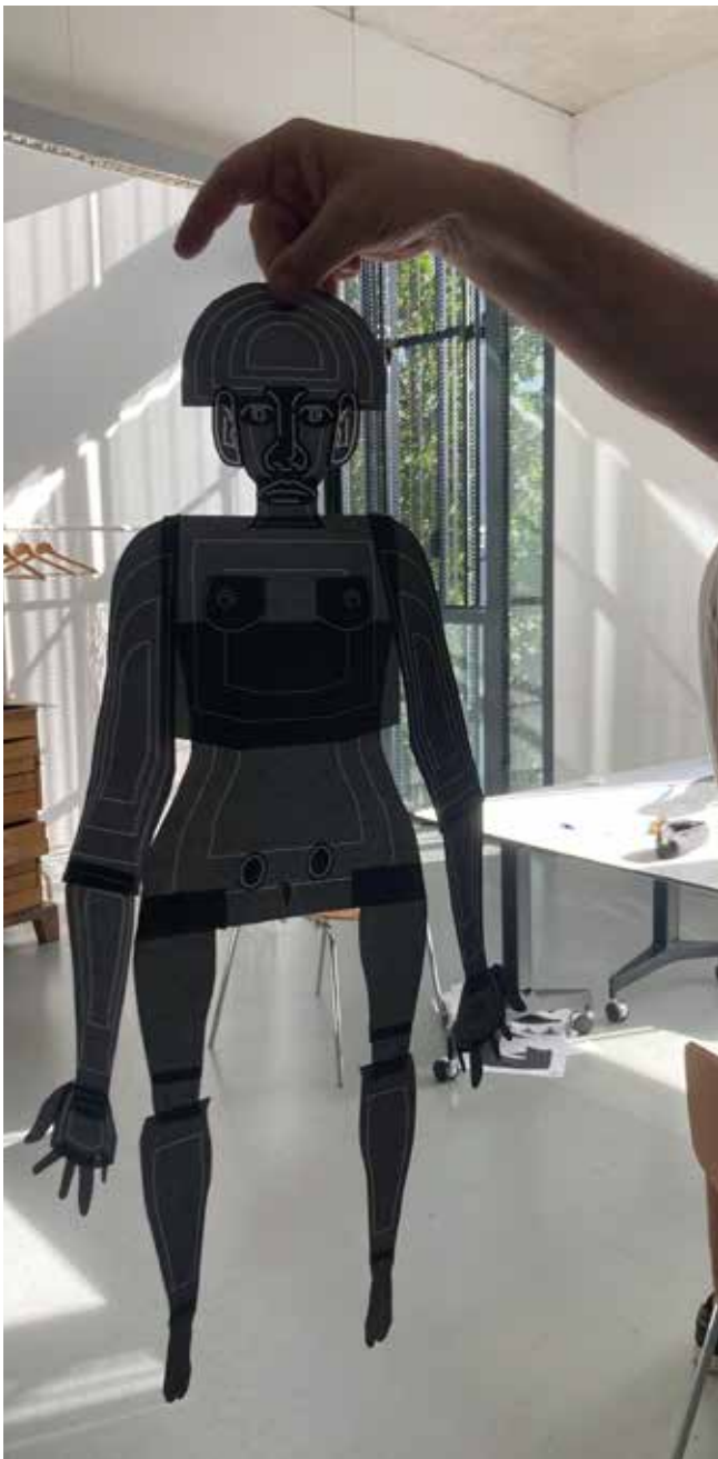
Escola Massana. Centre d'Art i Disseny Barcelona Mayo del 2023