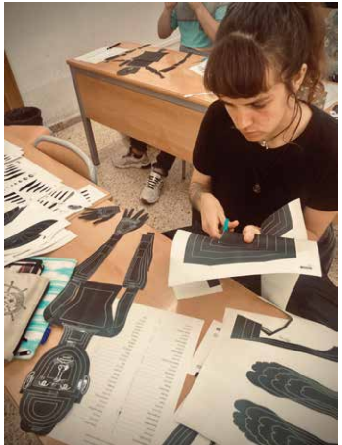
Facultad de Ciencias de la Universidad del País Vasco Master de Ilustración Científica Bilbao Mayo del 2023