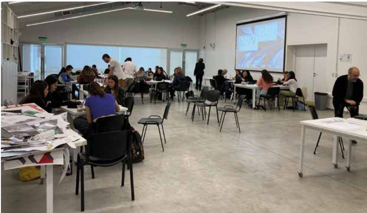
Universidad Torcuato DiTella Masterclass para estudiantes de Diseño Buenos Aires (Argentina) Octubre del 2022