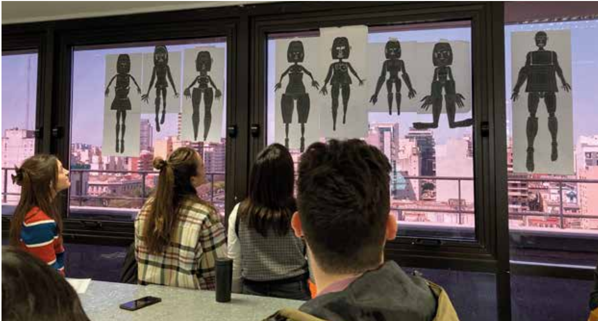
Universidad Argentina de la Empresa (UADE) Masterclass en el Master en Marketing e Identidad de Empresa Buenos Aires (Argentina) Octubre del 2022