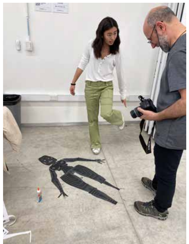
Universidad Torcuato DiTella Masterclass para estudiantes de Diseño Buenos Aires (Argentina) Octubre del 2022