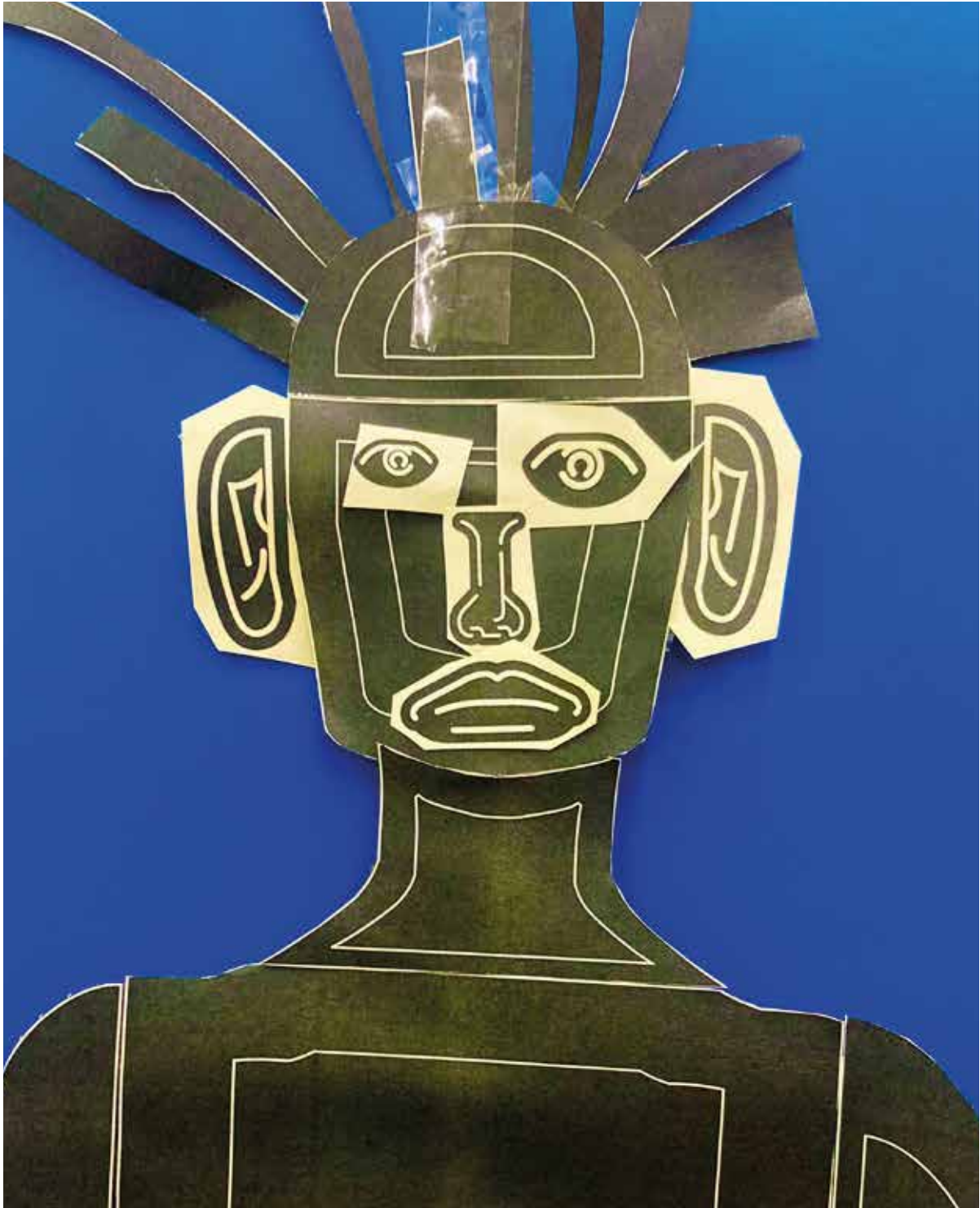
Detalle de una autorrepresentación construida por un asistente al taller 'El cuerpo en el cerebro'

NUESTRO CUERPO EXISTE, TANTO DE FORMA FÍSICA COMO CONCEPTO NEURONAL.