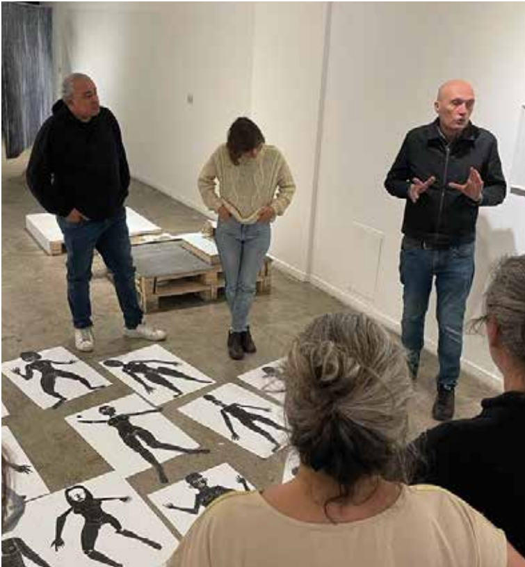
Centro Cultural de España en Buenos Aires (CCEBA) Taller de tres días 'Dibujarse con datos' Buenos Aires (Argentina) Octubre del 2022